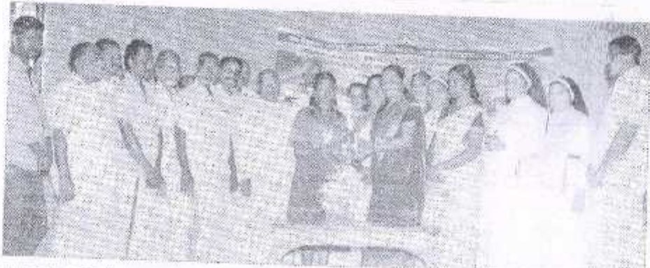
...യോജിപ്പിച്ചു. ...കർമ്മകളെ ...