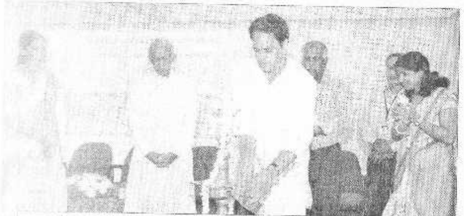
ുക്കുന്നു എക്കുന്നിയിൽ കോളയിൽ സംഘടിപ്പിച്ച യാഷണൽ സെമിനാർ കോള യൂണിവേഴ്സിറ്റി കം ുന്നു. അവേട്ടിയ ക്രോട് പ്രധാന ഡോ സ്വാന് വാര് ഇട്ടോടനം ചെയ്യുന്നു.