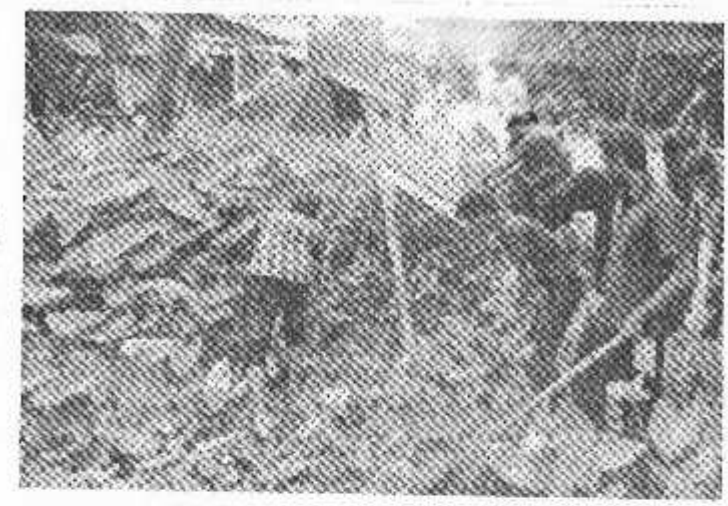
നെല്ലിമറ്റം എംബിറ്റ്സ് എൻജിനിയറിങ് കോളജ് എൻ എസ്.എസ്. യൂണിറ്റിനെ ച്ചി ധന്വഷ്കോടി മോഗീയപറതയിലെ സൈൻബോർഡുകൾ വൃത്തിയാക്കുന്നു.

1981ൽ പോള സർവകലാ ശാലയിൽ നിന്നും മെക്കാനി കൽ എഞ്ജിനിയറിൽിൽ ബിരുട വും 1984 കോഴിക്കോട് സർവക ലാഗാലയിൽ വിന്നും ബിരുമാന ന്നര ബിരുവവും എടുത്തതിനു ധേഷം 2010ൽ കൊച്ചി സർവക വാശാലയിൽ നിന്നും മമക്കാനി കൽ എഞ്ജിനിയറിക്കിൽ വേധ ക്ടറ്റ്വേം നേടിയിട്ടുണ്ട്. കോത മംഗലം ചെറിയതുരുത്തിൽ കുടുംബാംഗമാണ്.