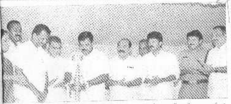
ാസിഡന്ന്സ് അസോസിയേഷത്യു് ഉദ്ഘടനം ജോസംമ് വാഴയ്ക്കൻ എ എത്.എ.